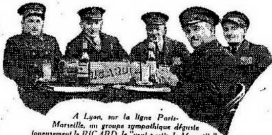
A Lyon, sur la ligne Paris-Marseille, un groupe sympathique déguste joyeusement le RICARD, le "vrai pastis de Marseille".